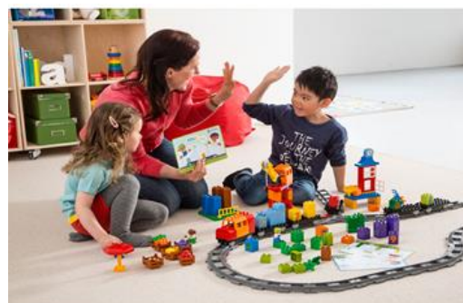
Например, собираем совместно с родителями

И вот вам маленький лайфхак, если ребенок поначалу проигнорировал конструктор LEGO: разложите детали на видном месте и начните собирать сами. В девяти случаях из десяти через полчаса вы будете уже вырывать инструкцию из рук у малыша.