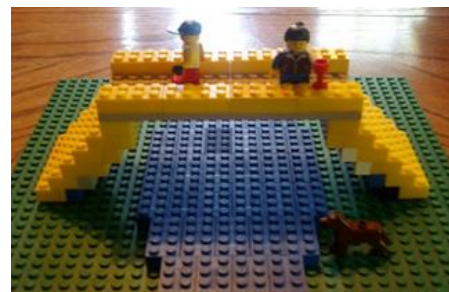
Например, собираем «Мостик»

Может, ребенок инженером и не станет, а структурно-логическое мышление еще никому не мешало. Девочек это тоже касается, ни в коем случае не нужно делить такие полезности на «м» и «ж»! Процесс сбора объемной конструкции по схеме развивает конструкторские навыки в отличном темпе. А если еще взять высокотехнологичные наборы, например, LEGO — пораскинуть мозгами придется как следует, а заодно их потренировать.