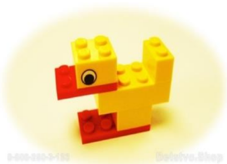
Например, собираем «Утенка»

Самое простое и очевидное. Ученые, психологи и другие умные люди официально заявляют: пока дети присоединяют детальки друг к другу, их мышцы развиваются, ловкость пальцев тоже, а за всем этим активно подтягивается, между прочим, речевой аппарат. Вот так вот. Малыш собирает LEGO — учится говорить.