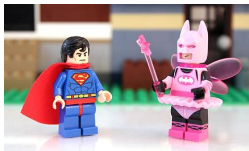
Например, собираем персонажей из мультфильма

Благодаря великому ассортименту LEGO® ваш ребенок сможет воплотить в играх свои самые смелые мечты. Моана запросто придет в гости в ледяной замок Эльзы, Ариэль совершит полет на волшебном эльфийском дирижабле, и никому за это ничего не будет. В общем, это идеальная возможность для «кроссовера» (встречи персонажей из разных вселенных), что способствует частым и длительным играм, развивающим навыки из пунктов № 1 - № 6. Сплошная польза.